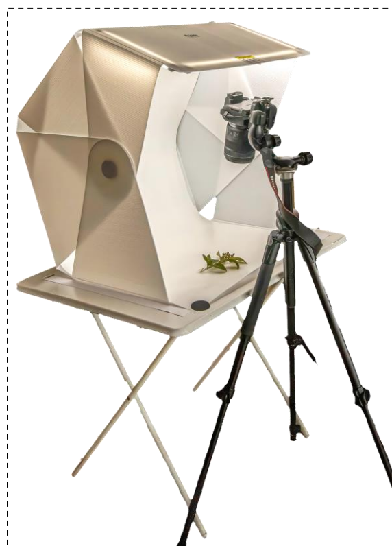
Figur 2: Fotostudio for nærfotografering.