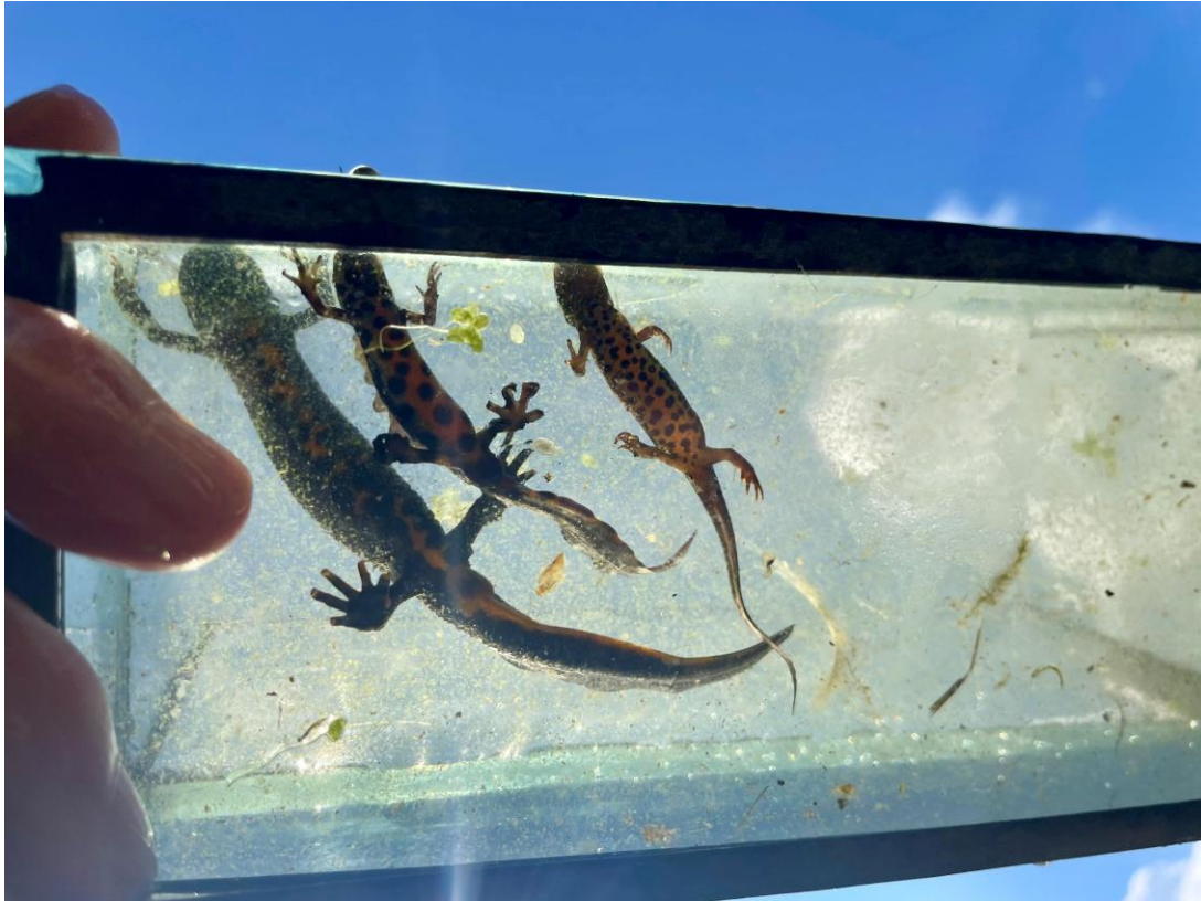
Fra venstre: storsalamander ( Triturus cristatus ) hunn, småsalamander ( Lissotriton vulgaris ) hann og småsalamander hunn.