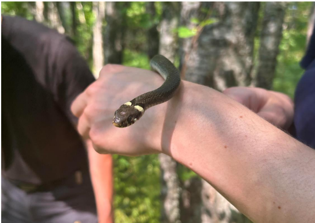
Figur 1 En av buormene ( Natrix natrix) fanget i første dam.