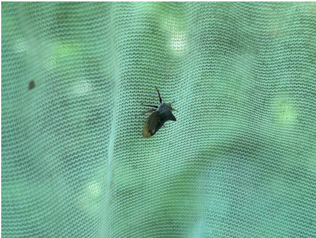
Figur 2 Hornsikade ( Centrotus cornutus).