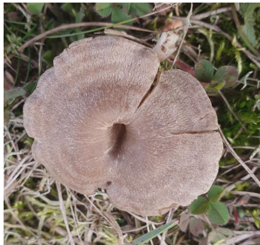
Beltevæpnerhatt – Clitocella popinalis