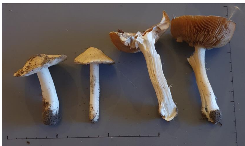
Stastrevlesopp – Inocybe splendens