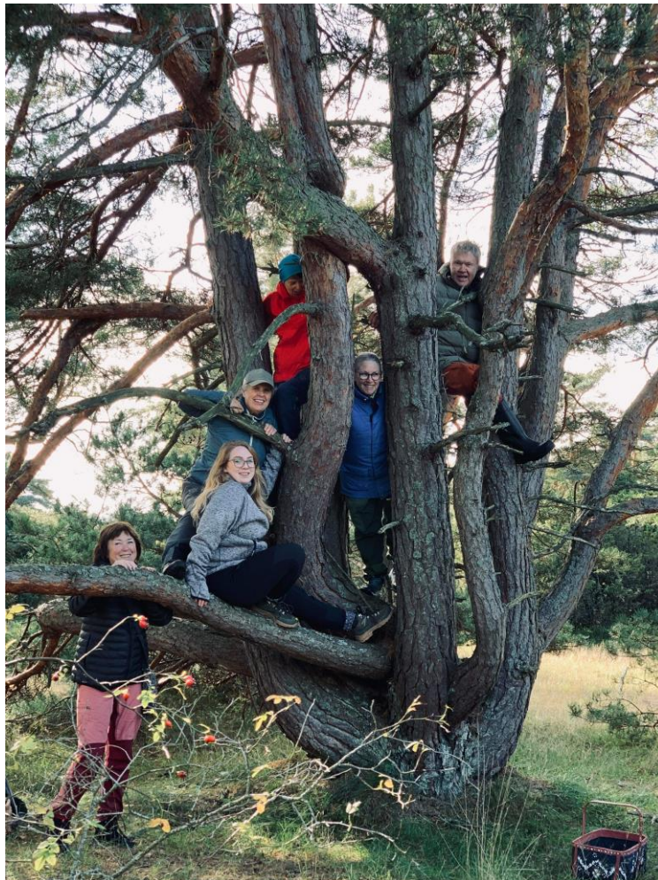
Noen av de ivrige kartleggerene

Emneord: Moss, Eldøya, Kollen, beitemark, strandenger, strandkratt.