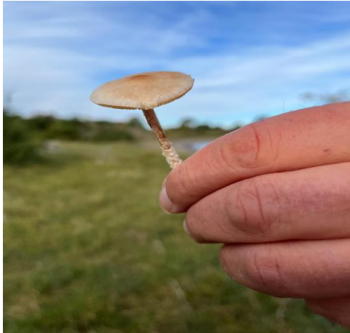
Blek parasollsopp - Lepiota oreadiformis

Andre interessante funn var bl.a. blek parasollsopp - Lepiota oreadiformis VU, beltevæpnerhatt – Clitocella popinalis NT og Geoglossum elongatum .