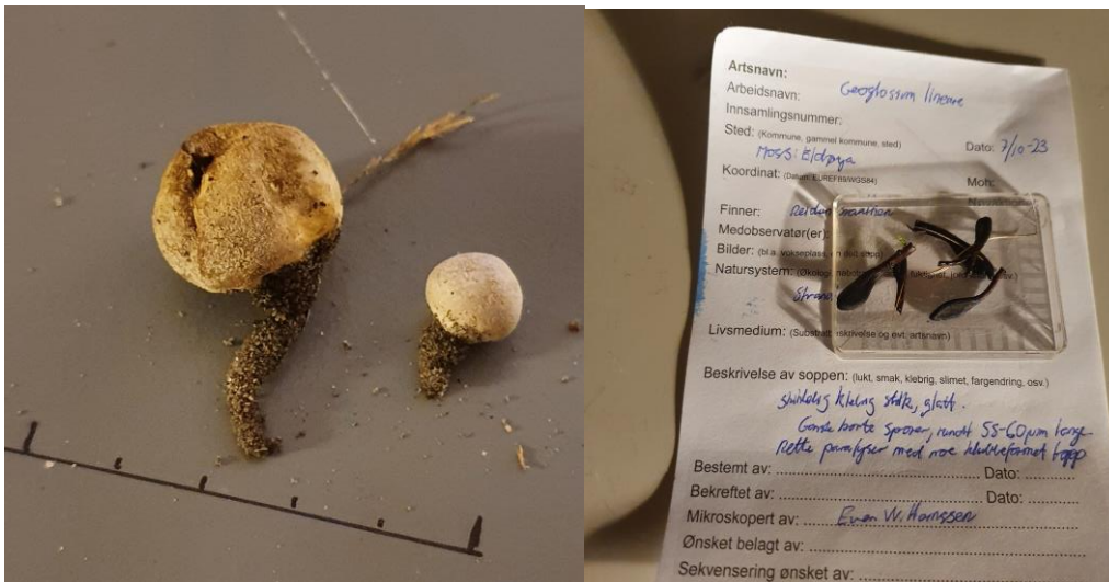
Dvergrøyksopp – Bovista furfuracea

Ni deltagere stilte opp på turen i flott høstvær. Det var fokus på sopp, men det er også registrert noen funn fra andre artsgrupper. Øya ble besøkt av foreningen i 2008 og 2014. Til sammen var det fra før registrert 129 sopparter. På årets tur ble det funnet hele 60 nye arter for øya, 155 funn ble registrert, tolv rødlistefunn av åtte forskjellige arter. Nitten bilder er lagt ut og fem av funnene er belagte, Ti arter var nye for Moss kommune, og fire av disse var heller ikke tidligere registrert fra Østfold. Disse artene var stastrevlesopp – Inocybe splendens VU , Dvergrøyksopp – Bovista furfuracea , stankridderhatt – Lepista densifolia og jordtunga Geoglossum lineare . Denne jordtunga var kun registrert fire ganger før i Artskart.