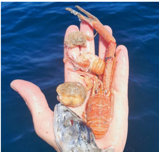
Bilde 7: Rombekrabbe og muddertrollkreps funnet i torskemage