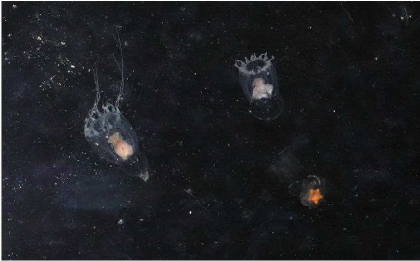
Bilde 8: Morild iblandet småmaneter, sjøstjernelarver og annet plankton.