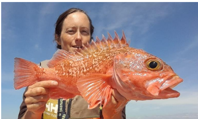
Bilde 2: Blåkjeften var der i år også!