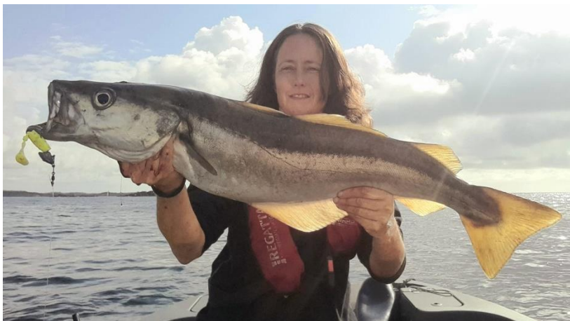
Bilde 1: Pen lyr tatt på shad på grunna.

Alle observasjonene er registrert på artsobservasjoner.no, og markert med prosjekt "kartleggingsmidler Sabima".