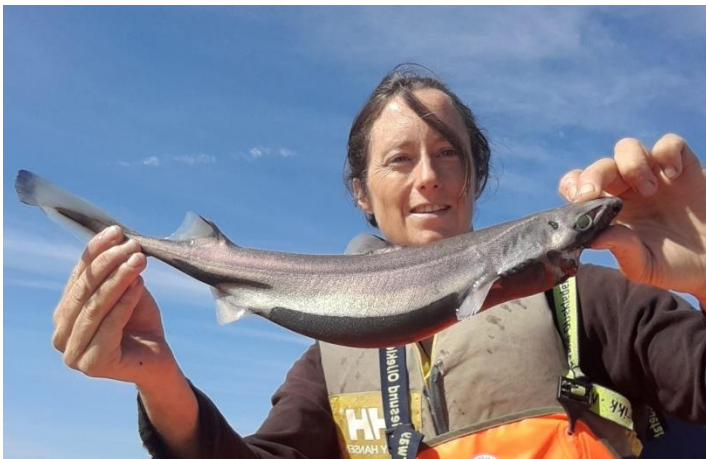
Bilde 5: Svarthåen er en notorisk agntyv på dypet!