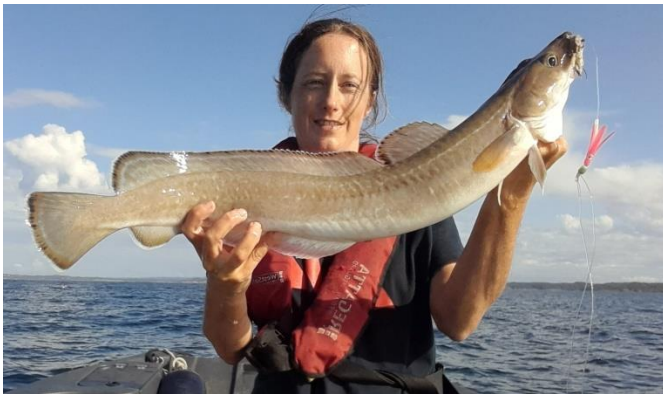
Bilde 4: Mye smålange å få som vanlig!