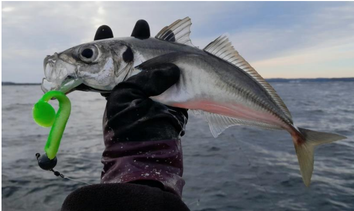
Bilde 6: Mye taggmakrell tidlig i oktober.