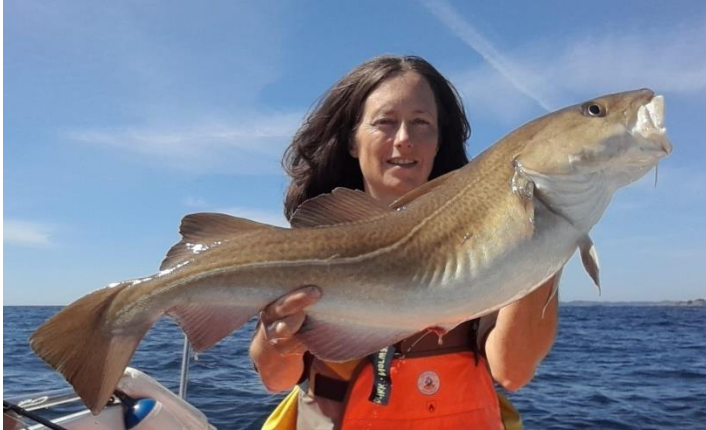
Bilde 3: Fin sommertorsk.