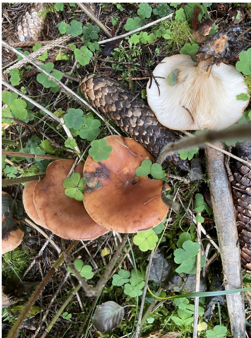
Gulbrun ridderhatt Paralepista flaccida frå Marfjellhaugane i Sogndal 7.10.2023.