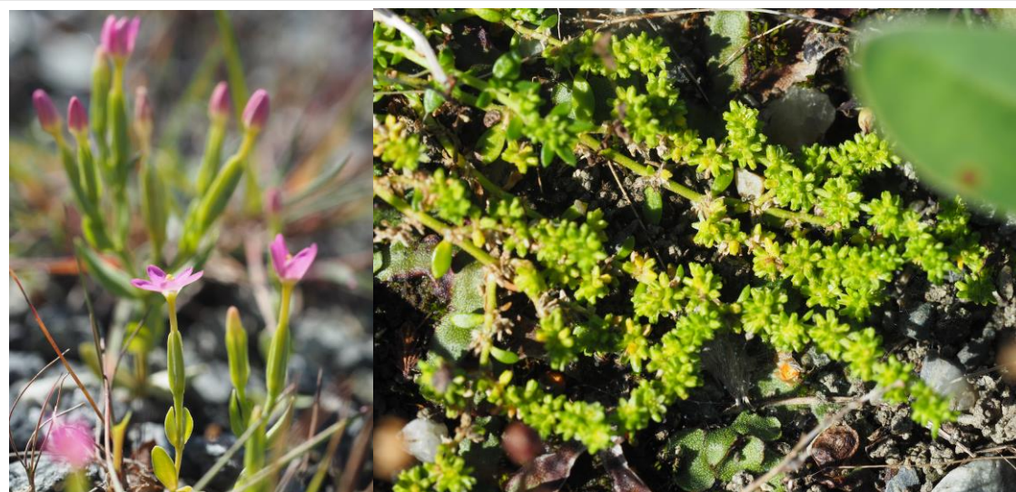
Figur 6 Dverggylde og brokkurt funnet på Rinnleiret i Levanger kommune