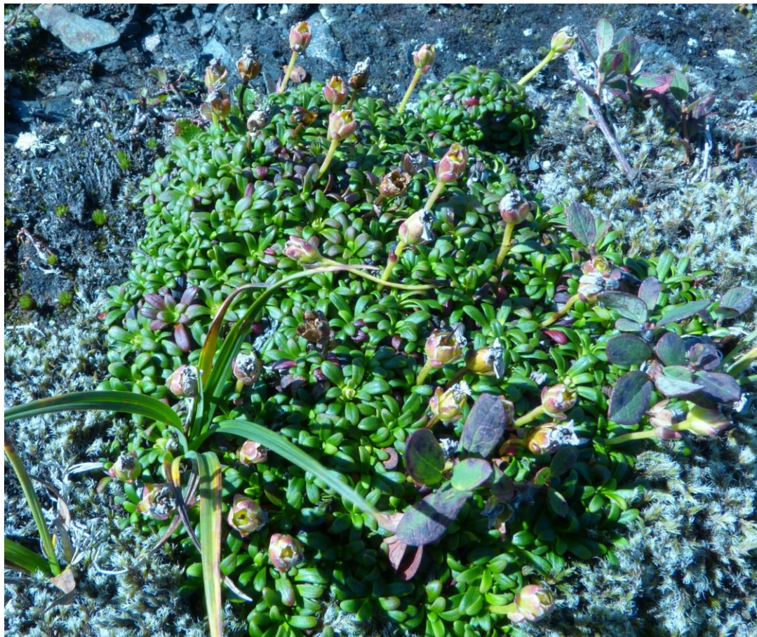
Figur 3 Fjellpyrd var eneste rødlisteart

Det ble ikke funnet rødlistearter annet enn fjellpyrd ( Diapensia lapponica L.), som er listet som nær truet. Se fig. 3.