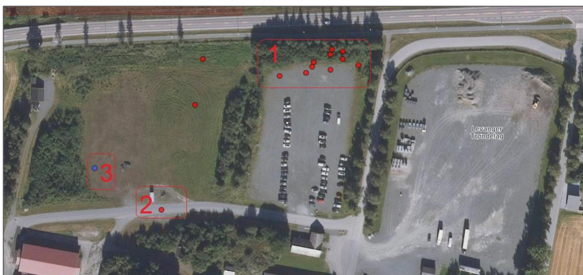
Figur 5 Områder på Rinnleiret der det er registrert dverggylde (røde punkter) og brokkurt (blått punkt)