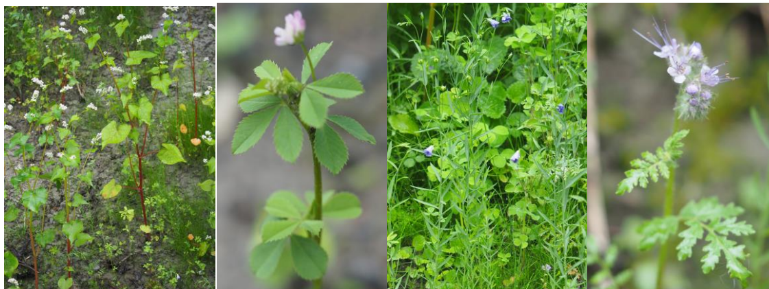
Figur 4 Fremmedarter ved Homlen: Bokhvete, vendekløver, lin og honningurt

resupinatum L.), lin ( Linum usitatissimum L.) og honningurt ( Phacelia tanacetifolia Benth.).