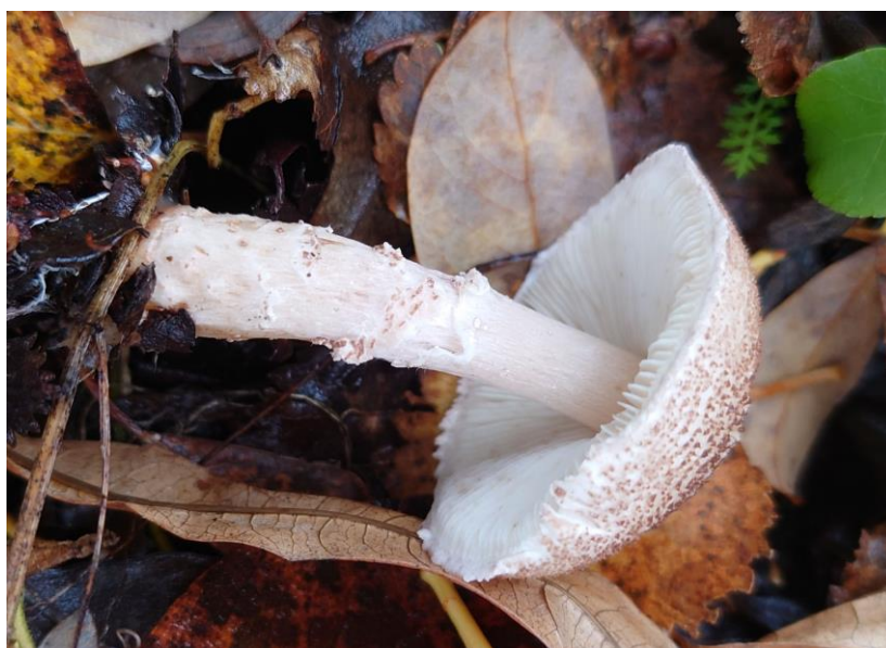
Kastanjeparasollsopp funnet på Verigas

Miraculix har gjort en hel del spennende funn og kommer til å publisere en artikkel om det vi mener kan være polemochoresopper. Dette er et prosjekt som blir flerårig. Dersom Sabima ønsker å være delaktig i dette prosjektet, setter vi stor pris på det. Når det gjelder de to andre målene vi hadde satt oss, må vi dessverre melde at vi ikke fant det vi var ute etter. Dette skyldes den usedvanlig korte soppsesongen, men vi kommer til å fortsette å lete etter både dvergmusserongen og alpine arter i årene som kommer.