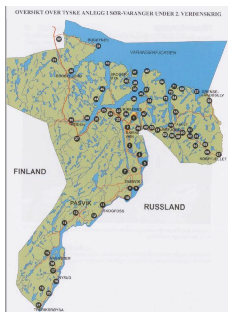
Kart over tyske anlegg under andre verdenskrig (utarbeidet av Kosnes og Siira)

Antall registreringer i artsobservasjoner: 791