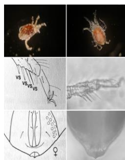
( Halacarellus petiti )

I Norge har vi med dette notatet registrert til sammen 55 arter. På verdensbasis er det beskrevet om lag 1100 arter.