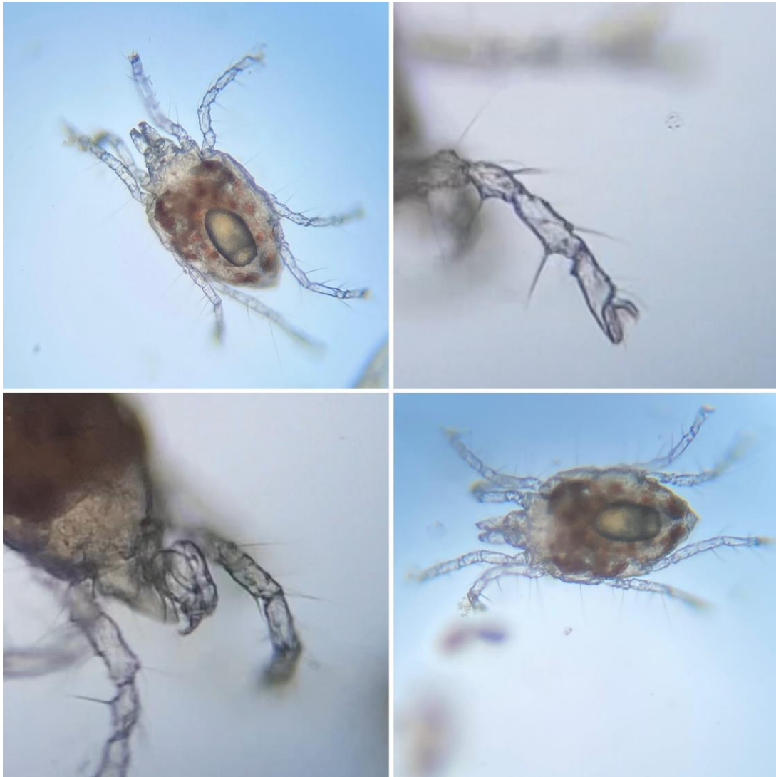
( Limnohalacarus wackeri )