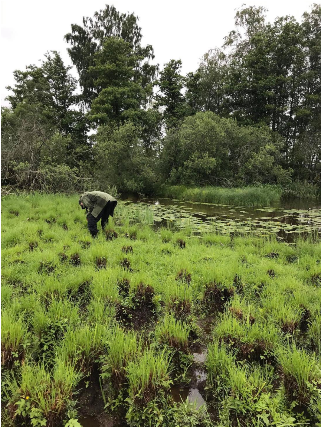
Florakartlegging i våtmark i Aremark.