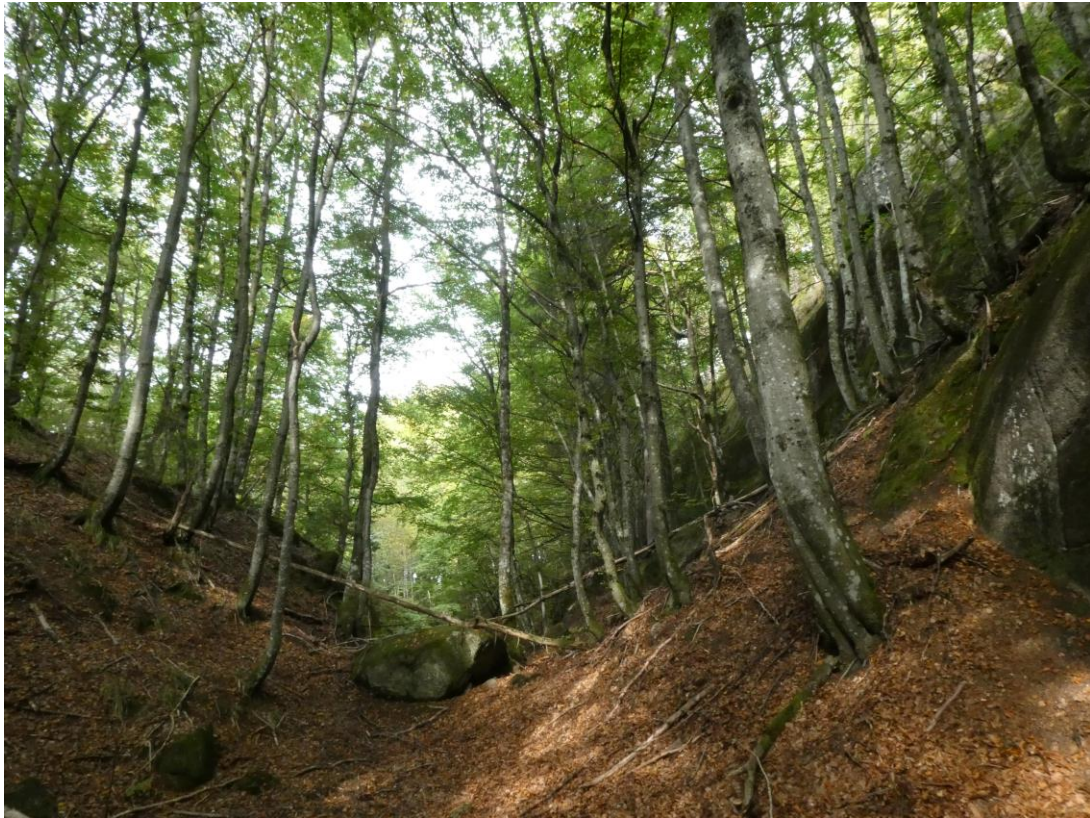
Bøkeskogen i Korpen. 20.sept.

Søndag 20.sept ble det tur til Korpen og Sagkollen naturreservat og det ble registrert 151 arter (uthentet fra artskart 25.10.20), og flere rødlistearter (Tabell 1). Interessante funn: rugleskinn ( Metulodontia nivea ) (NT), kronepiggsinn ( Sistotrema raduloides ) (NT), piggskorpe ( Dentipellis fragilis ) (NT), knuskkjukemøll ( Scardia boletella ) (EN), bøkekjuke ( Trametes gibbosa ) og kanskje 1-2 nye kjuker for Norge (må undersøkes nærmere). Korpen og Sagkollen består av edellauvskogtyper: gammel bøkeskog, ask- og almedominert skog og eik-lindeskog.