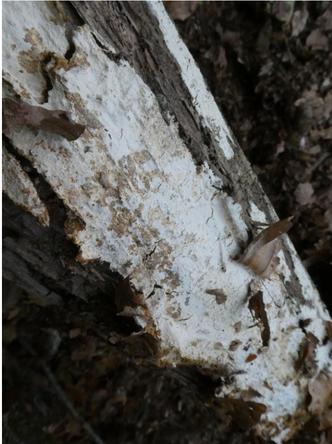
Flott eksemplar av rugleskinn (Metulodontia nivea) NT. Korpen 20.sept.