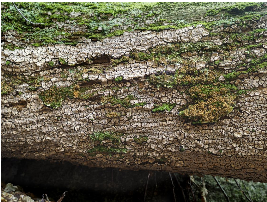
Ruteskorpe (Xylobolus frustulatus) NT. Korpen naturreservat 20.sept.