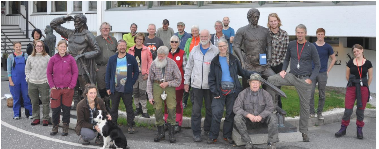
En god og kunnskapsrik gjeng. Holms Motell, Restaurant og Business senter.