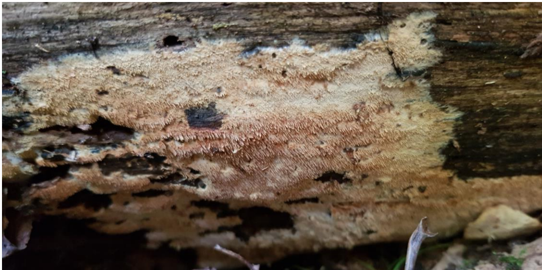
Kronepiggsjinn (Sistotrema raduloides) NT på osp i Jordstøyp.