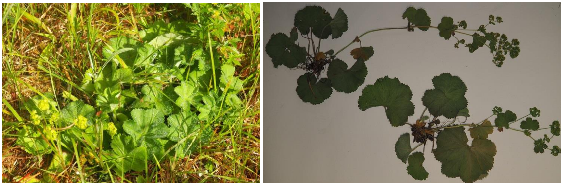
Figur 4 Hjulmarikåpe

Søndag 9. august ble det registrert på østvendt rikmyr litt nord for Bryggneset. Dette ga første registrering i Verdal av hjulmarikåpe (belagt), andre registrering av vierstarr (belagt, foto på forsida).