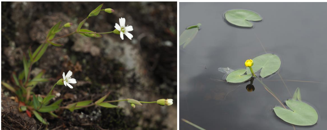
Figur 3 Småsmelle til venstre, soleinøkkerose til høyre

Lørdag 8. august ble det registrert på østsiden av Juldalen, litt lenger inn i dalen. I dalbunnen var det en del granskog. På myrene og heiene over skogen var det fattig til middels rik grunn. Det var ingen store botaniske overraskelser, men noen hyggelige funn: andreregistrering (i følge Artskart) i kommunen av småsmelle og soleinøkkerose (belagt).