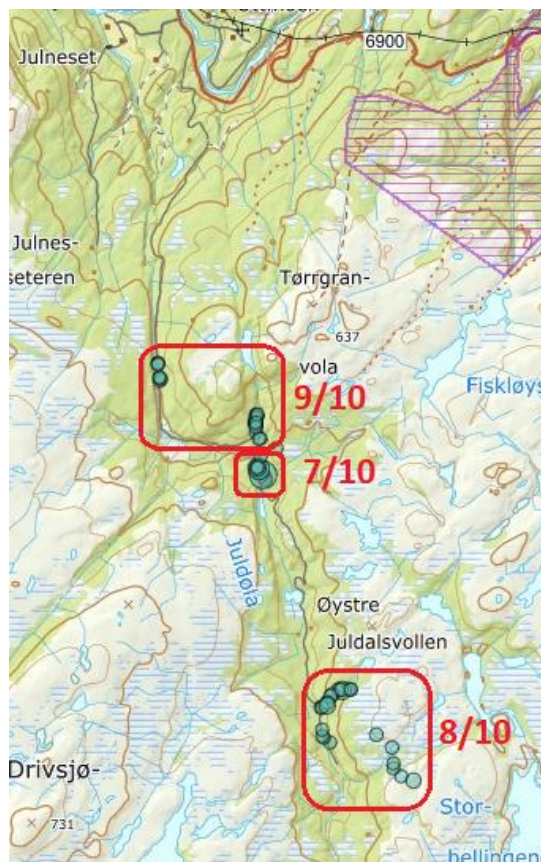
Figur 1 Registreringsområder

Funnene er listet ut i vedlegg 1. Registreringspunktene er vist på kart i figur 1. Årets registreringer kan finnes i artsobservasjoner ved å søke på Karplanter , registrert 07.08.2020 – 09.08.2020 på prosjekt «Midt-norsk lokalfloraprojekt». Det ble også tatt belegg til NTNU-Vitenskapsmuseet av 50 arter, der en god del av dem som ikke var belagt i kommunen de siste 50 år. Ingen av funnene hadde rødlistestatus.