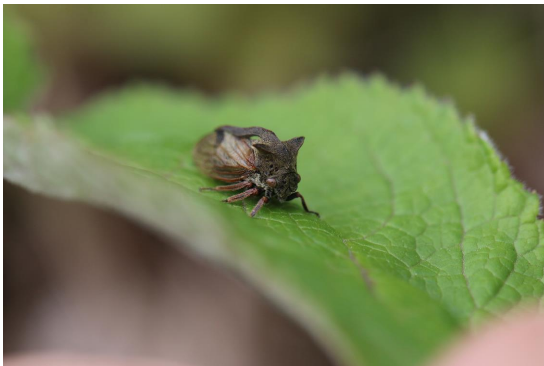
Hornsikade Centrotus cornutus fra Sandbekk 21.05.2020.

Videre har målrettet håving og fotografering vært brukt som metoder for å samle inn og dokumentere dyr. Lepidoptera har kun blitt fotografert, men enkelte dyr er blitt samlet inn til Stavanger Museum (MUST). Tovinger (Diptera) og årevinger (Hymenoptera) har blitt samlet inn og satt på nål for videre bestemmelse.