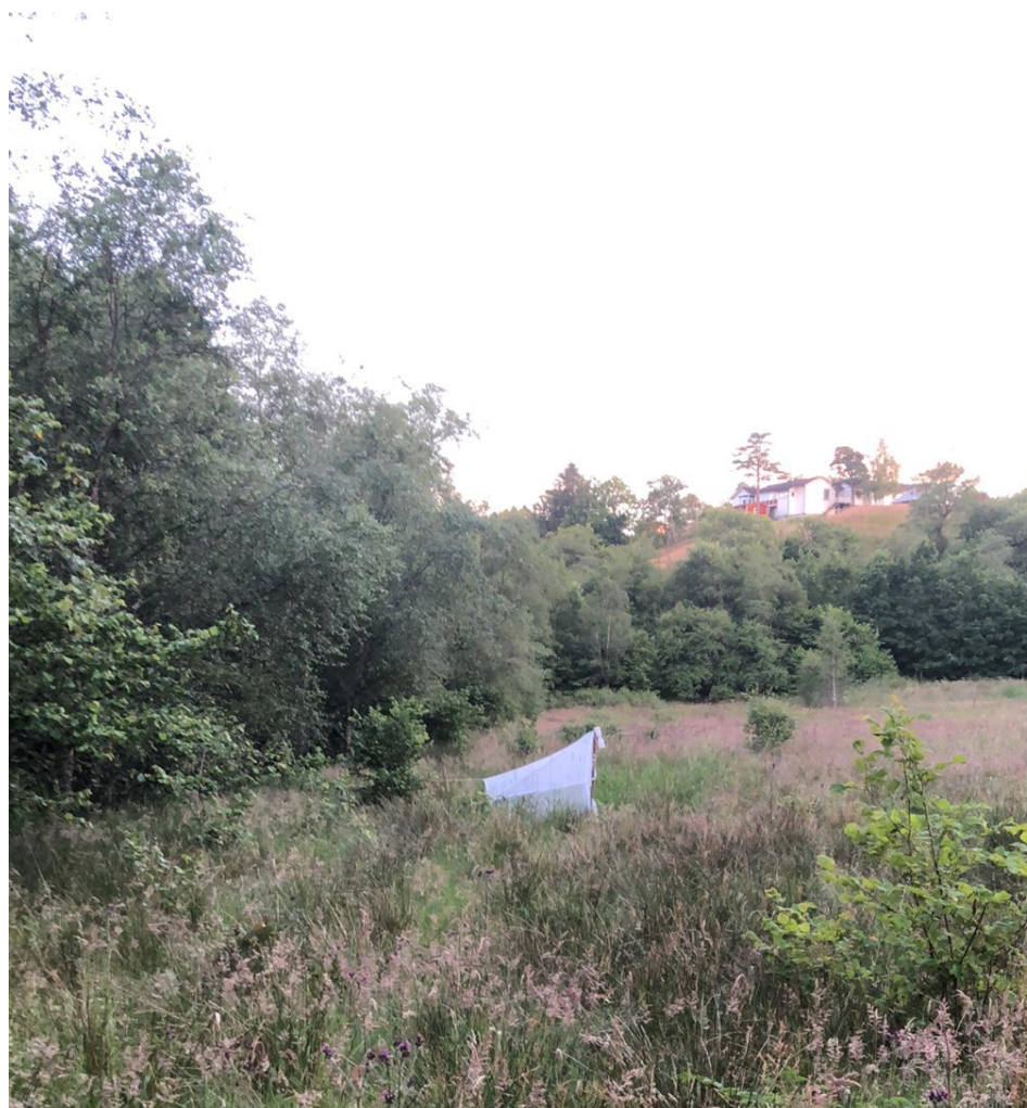
Fella i Skittmyr.

Metoder: malaisefelle, håving og observasjoner.