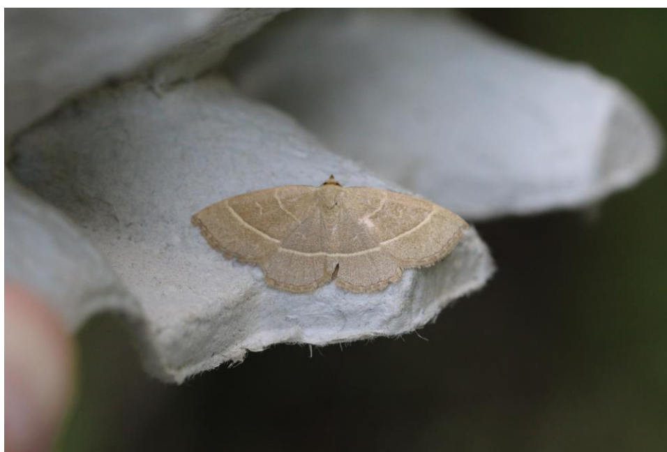
Olivenfly Trisateles emortualis , på vestgrensen av utbredelsesområdet sitt i Norge.