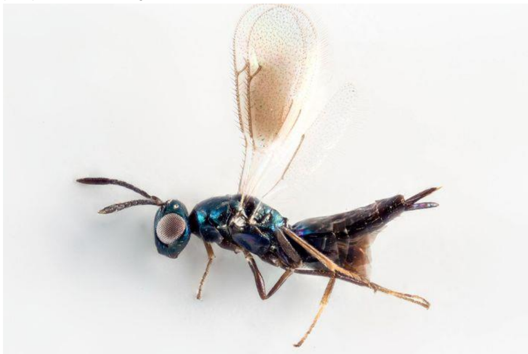
Spalangiopecta procera hunn fra Sandbekk 2018, publisert som ny for Norge i NJE 67 vol 1.2020.

Jeg har som tidligere sendt materiale til flere andre prosjekter som er støttet av Artsdatabanken. Dette vil forhåpentligvis komme i artskart etter hvert som prosjektene blir ferdigstilte.