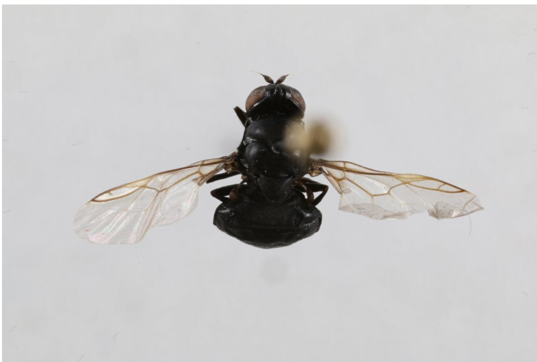
Barkvåpenflue Berkshiria hungarica - funnet i en malaisefangst i Skittmyr. Den er rødlistet i kategori NT. Iflg. Artskart er den ikke funnet i Rogaland før.