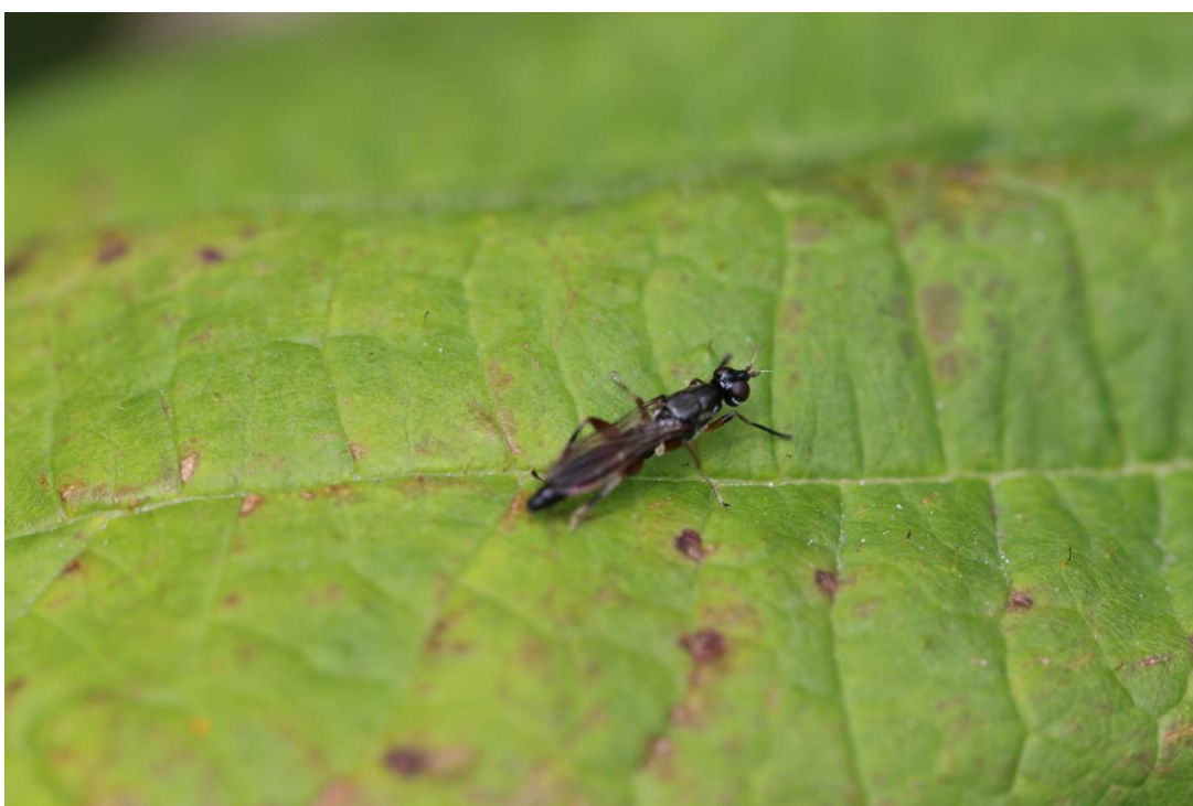
Megamerina dolium - en sjelden flueart. Dette funnet er det første vest for Arendal. Løgevig 20.07.2020.

Lokaliteten ligger på østsiden av Rekefjord pukkverk. Den er sterkt påvirket av pukkverksdriften da fjellmasser og sprengstein grenser opp mot lokaliteten. Lokaliteten var tidligere bebodd, og det er spor etter hustuffer og frukthager. Her er rik gras- og urtevegetasjon. De dominerende treslag er eik og hasselkratt. Lokaliteten ligger rett ved sjøen og har et mildt klima hvor det blant annet vokser et stort valnøttre som bærer frukter hvert år. Metoder: håving og observasjoner.