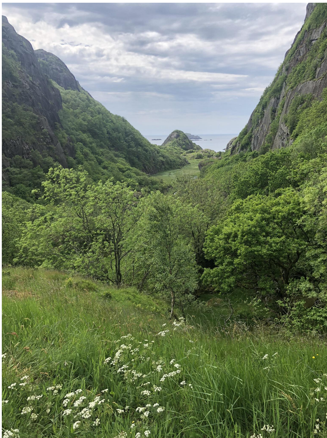
Knubedal er en svært spennende lokalitet som ble besøkt to ganger i løpet av sesongen 2020. Her 12.06.2020.