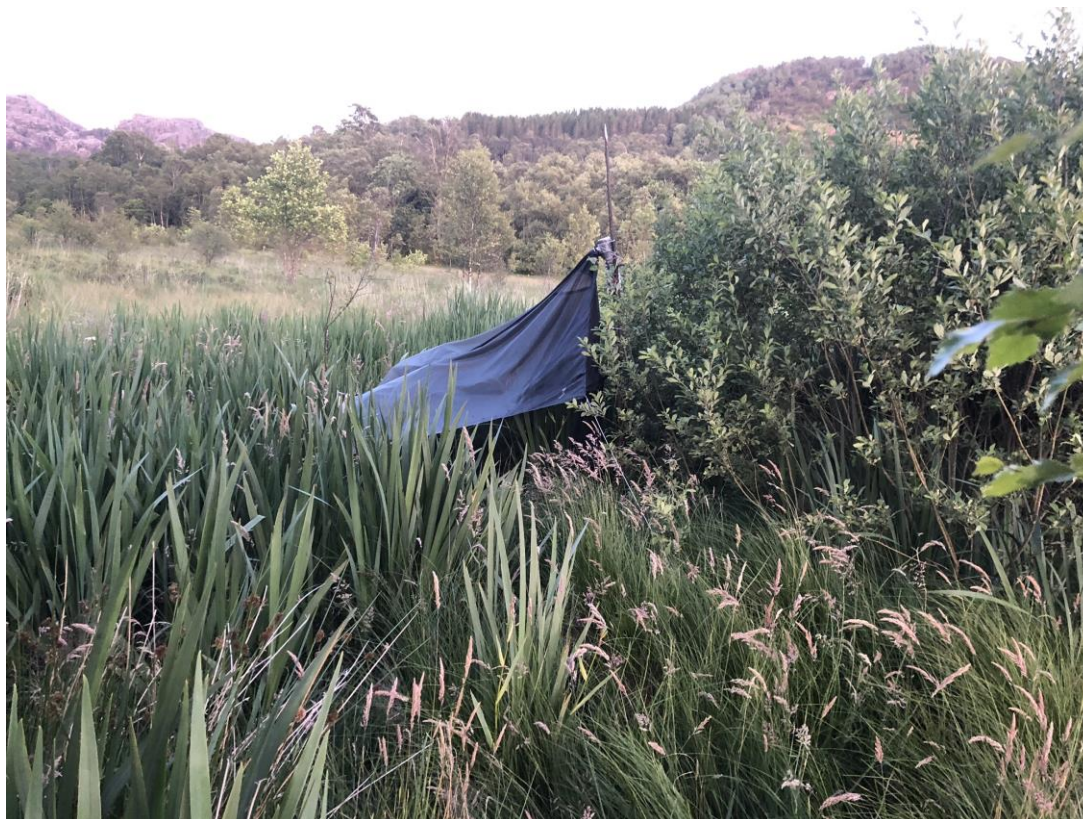
Fella i myra på Årstad.