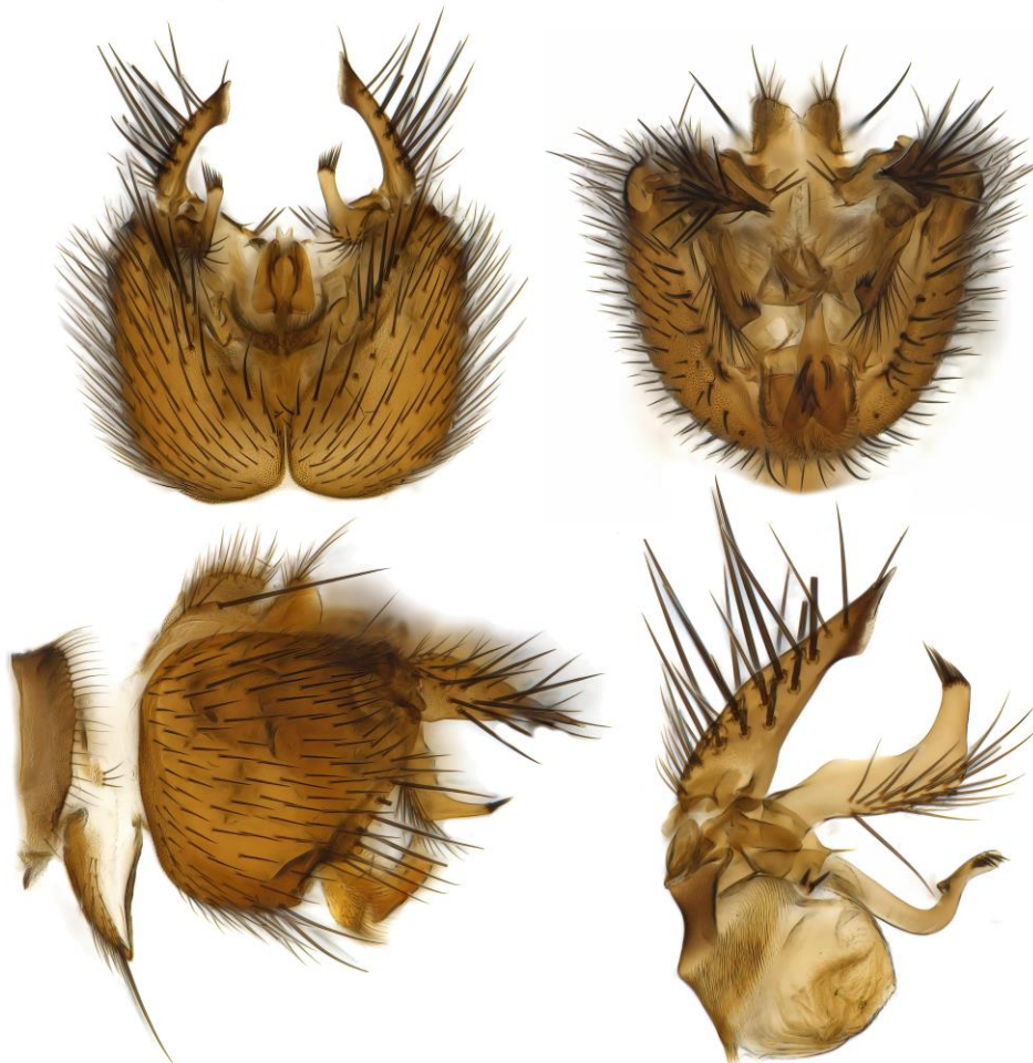
Genitalieilde av soppmyggen Brachycampta angulata. Fra malaisefella i myra på Årstad, lokalitet nr 8.

Fangstene fra malaisetelt og SLAM- feller er gjennomgått. Jeg har plukket ut de dyrene som jeg har kompetanse til å bestemme selv. Dette arbeidet er ikke avsluttet, og vil nok pågå en stund videre ut over høsten/vinteren. Alle sikre observasjoner registreres på AO.