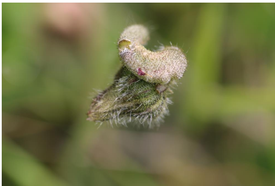
Galle på hårsveve Pilosella officinarum . Gallen dannes av fluen Tephritis ruralis , en tallrik art i lia på Vardåsen 13.06.2020.