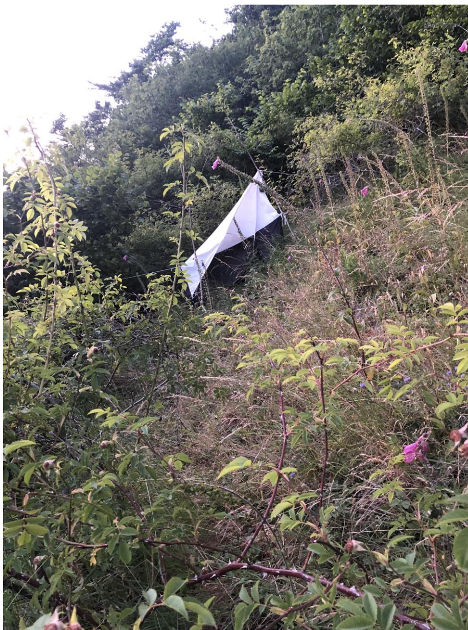
Vardåsen 10.07.20 - en frodig tørrbakke.

Lokaliteten er en sørvendt tørrbakke som ligger rett ved Rekefjord pukkverk. Denne lokaliteten inneholder en rekke sjeldne plantearter, og har tidligere vært dårlig undersøkt. Årets undersøkelser har gitt en rekke interessante funn. Spesielt kan nevnes rødhalet måneflekkflue Eumerus sabulorum VU. Metoder: malaisefelle, fallfelle, håving og observasjoner.