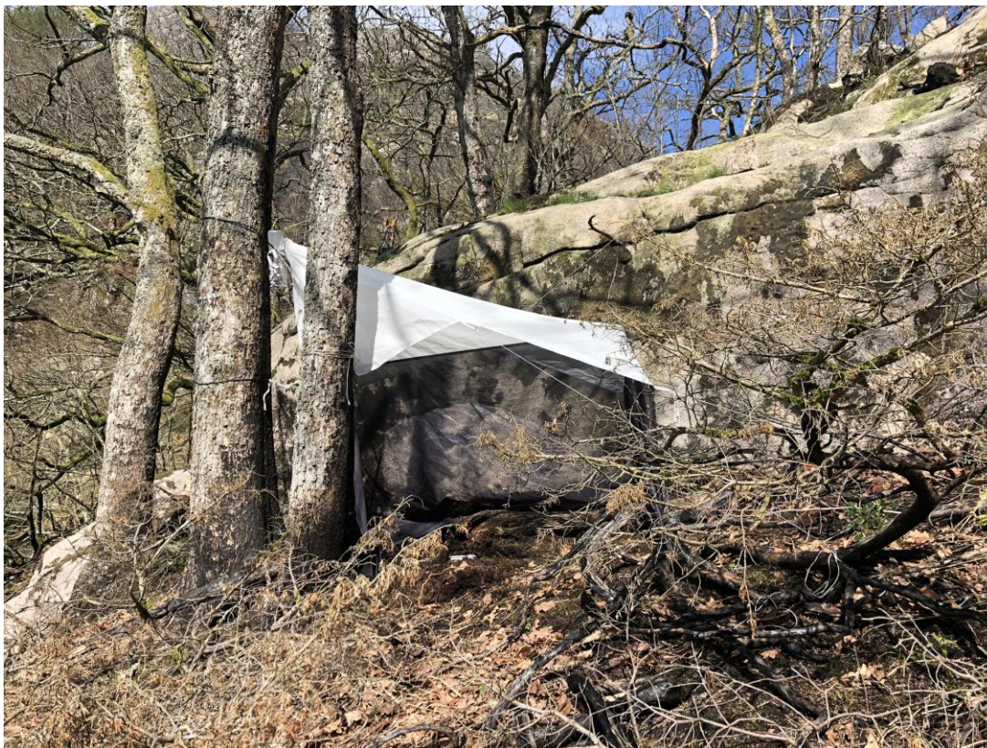
Fella på Heggdal når den ble satt opp 13.04.2020.