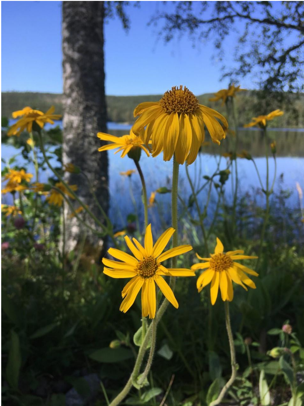
Solblom ble funnet på flere nye lokaliteter i Rømskog.