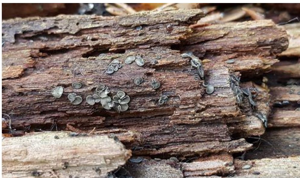
I mai ble det en førsteregistrering for Norge ved Skullerudstua, Pyrenopeziza benesuada . Deconica subviscida ble funnet sammen dag og var ny for Oslo.

Ved Østensjøvannet ble det flere funn av arter som tidligere ikke har vært registrert i Oslo, spesielt til glede for Østensjøvannets Venner som presenterer funnene på sin facebookside. På første turen fant vi Hymenoscyphus fructigenus på hasselnøttskall. På den andre turen fant vi Didymium nigripes , en slimsopp som ikke har vært registrert tidligere i Oslo. Sumpseigsopp ble registrert for første gang i Oslo på over 100 år.