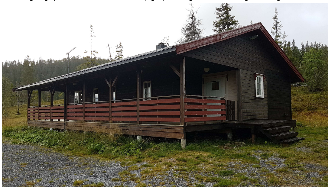
Figur 1 Finnvolastua.

I 2018 har vi fortatt registreringene i området Skardfjellet og nord for Innsvatnet med utgangspunkt fra Finnvolastua (fig.1) lørdag 25. til søndag 26. august.