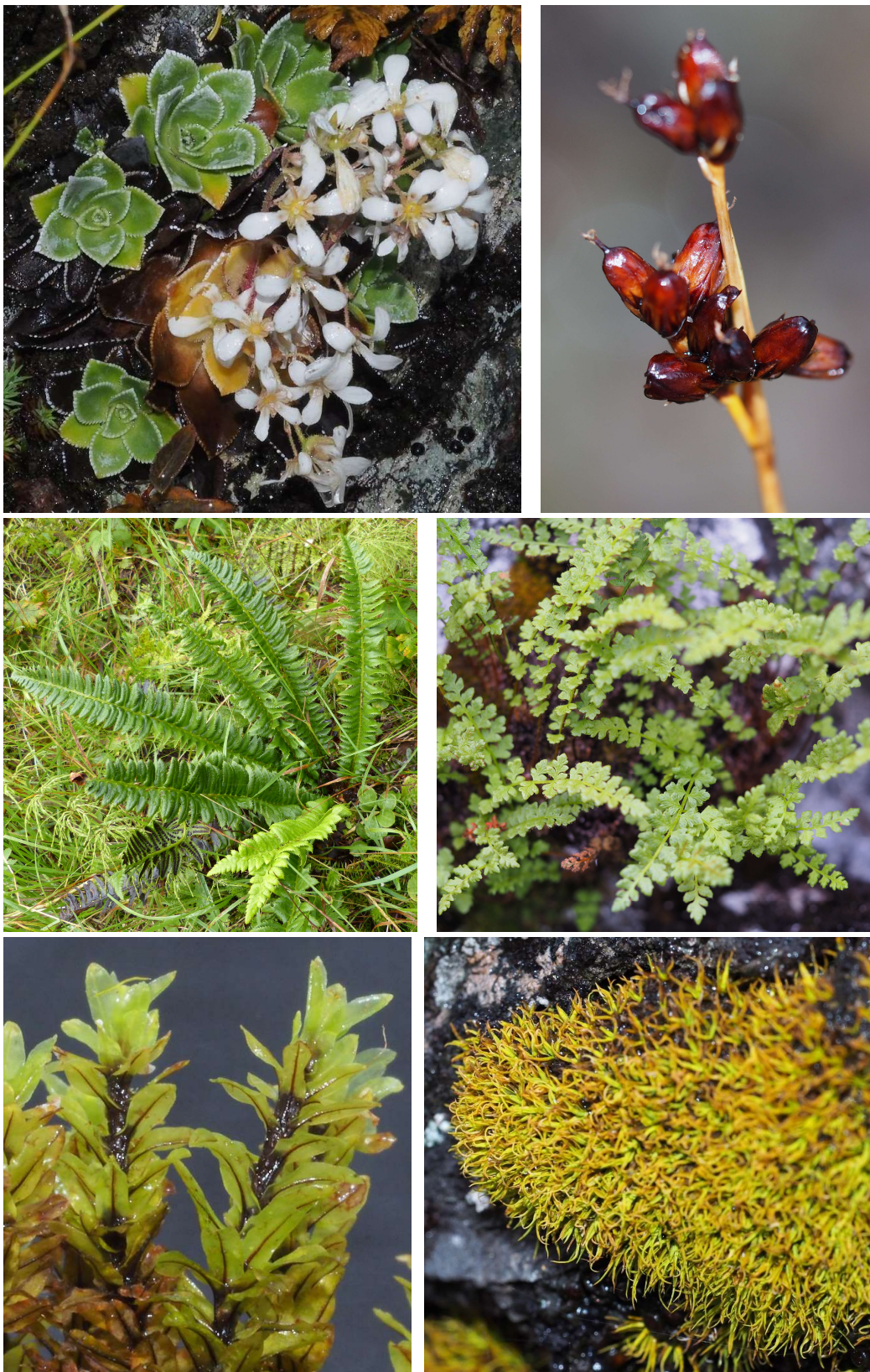
Figur 4 Bergfrue ( Saxifraga cotyledon ), kastanjesiv ( Juncus castaneus ), taggbregne ( Polystichum lonchitis ), fjell-lodnebregne ( Woodsia alpina ), storklokkemose ( Encalypta streptocarpa ) og skjørnrimose ( Tortella fragilis ).

Området har ganske rik berggrunn, med funn av krevende arter som bergfrue, kastanjesiv, taggbregne, fjell-lodnebregne, marinøkkel, skjørnrimose og storklokkemose. Noen av disse er vist i figur 4. I følge NGUs berggrunnskart er hovedbergartene sandstein og leirskifer med lag av metagråvakke, tildels med serisitt.