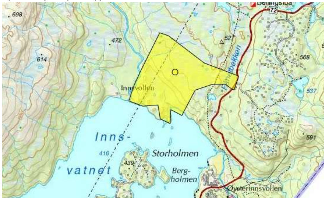
Figur 5 Registreringsområdet søndag 26/10. Kartutsnitt fra Artsobservasjoner.

På søndag registrerte vi i nordkanten av Innsvatnet. Området besto for det meste av myr og blandingskog. I tillegg var det ferskvannsstrand ned mot vatnet.