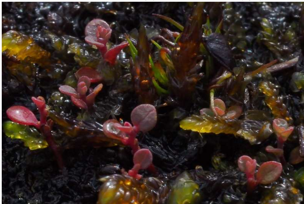
Figur 3 Dvergsyre ( Koenigia islandica ).

En art med status NT ble funnet: dvergsyre, Koenigia islandica (fig.3).