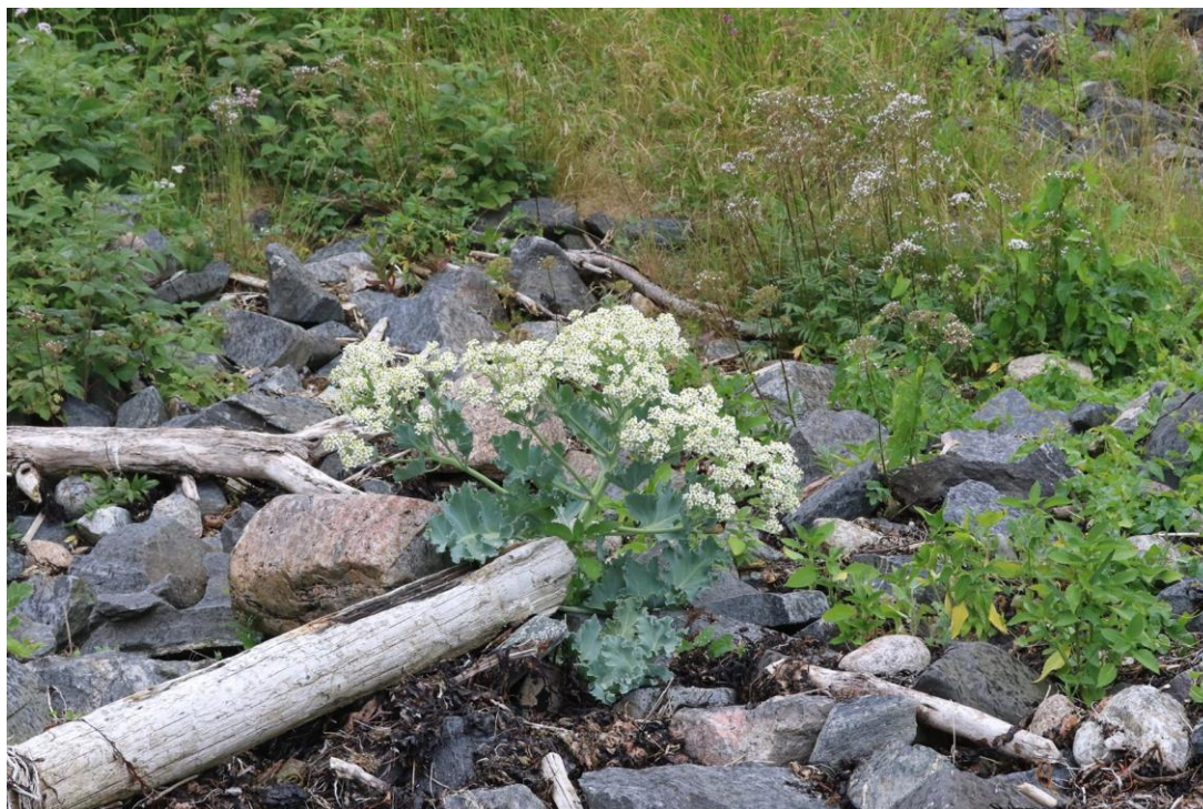
Stråndkål Crambe maritima fra Kvåviga på Flekkerøya. Typisk representant for holmenes strandvegetasjon.

Artsfunn blir for det meste registrert i Artsobservasjoner og der merket med prosjekt «Kartleggingsmidler Sabima».