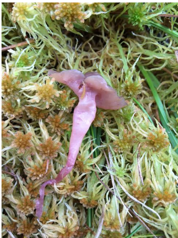
Sumpfiolbeger Ascocoryne turficola, Foto:

Deltakarane møtte fredag kveld på Knausen Hyttegrend der ein ombygd låve stod til disposisjon for studier av sopp og sosialt samvære. Deltakarane hadde med funn dei hadde gjort i forkant, mellom anna 2 sjeldne og rødlista artar, sumpfiolbeger, Ascocoryne turficola og seig østerssopp, leurotus dryinus .