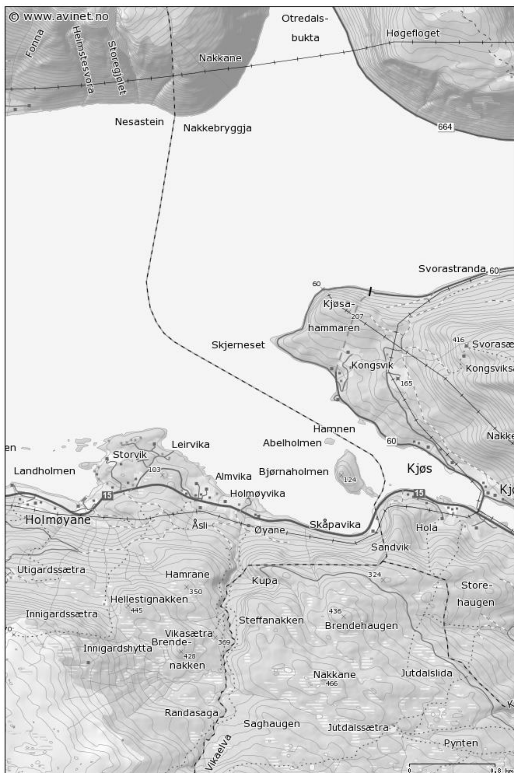
Kart over området ved Kjøshammaren, Hornindal