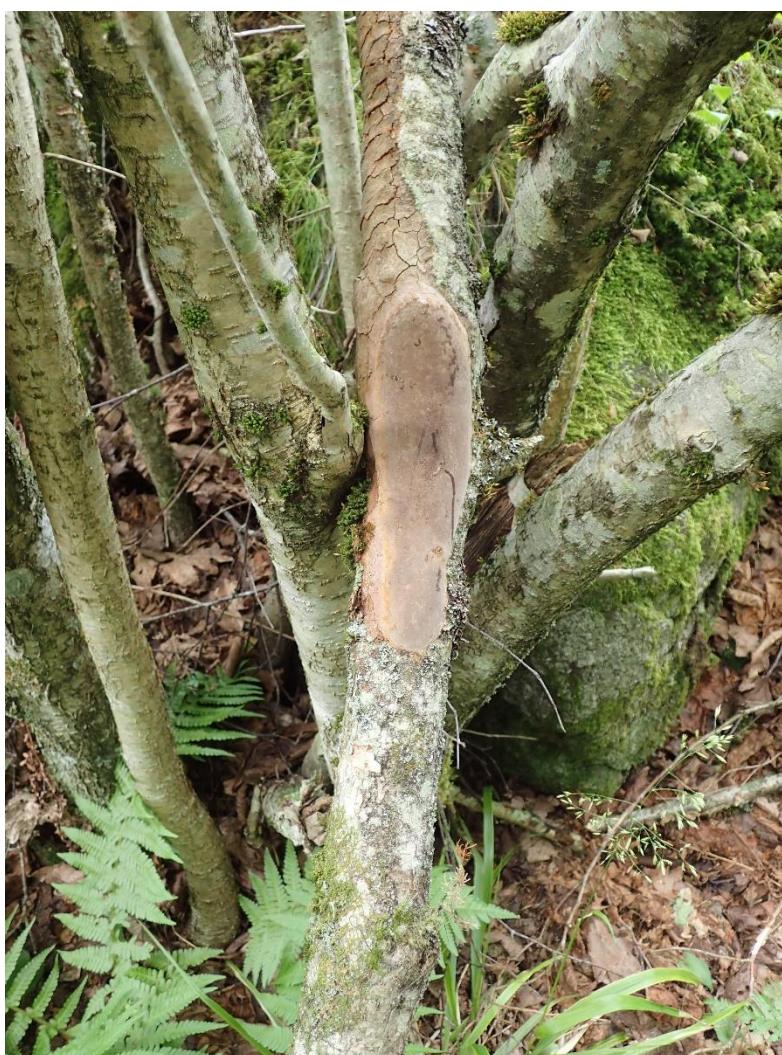
Putekjuka på hassel

Av Dagny Mandt for Larvik Botaniske Forening